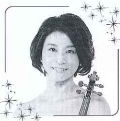
高嶋 ちさ子 Chisako Takashima

6歳からヴァイオリンを始め、これまでに徳永二男、江藤俊哉、ショーコ・アキ・アールの各氏に師事。桐朋学園大学を経て、1994年イェール大学音楽学部大学院修士課程アーティスト・ディプロマコースを卒業。1997年には本拠地を日本に移し、本格的に音楽活動を始める。フジテレビの軽部真一アナウンサーとの共同プロデュースによる「めざましクラシックス」は1997年に始まり、現在までに通算公演回数300回を超える人気コンサートとなり20周年を迎える。2006年の自身のソロデビュー10周年時に企画・プロデュースし「12人のヴァイオリニスト」を立ち上げた。「観ても、聴いても、美しく、楽しいヴァイオリンアンサンブル」というコンセプトでクラシックの敷居の高さを払拭し、クラシック音楽やヴァイオリンをより身近に感じてもらえるように活動を行っている。2016年7月6日には結成10周年を迎える12人のヴァイオリニストをメインに「高嶋ちさ子 12人のヴァイオリニスト」名義で約4年ぶりとなるニュー・アルバム「MUSE ~12 Precious Harmony~」をリリース。同年9月より2017年2月まで全国コンサートツアー10th Anniversary 高嶋ちさ子 12人のヴァイオリニスト「MUSE~Best 12 Harmony~」を開催。現在、演奏を中心にイベントやコンサートプロデュースに加え、テレビやラジオなどの各種メディア出演、執筆など活動の場は多岐に渡る。オフィシャルHP www.takashimachisako.jp