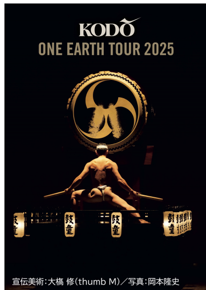
宣伝美術:大橋 修(thumb M)

主催:TeNYテレビ新潟 共催:柏崎市文化会館アルフォーレ(公益財団法人かしわざき振興財団) 企画・製作:北前船